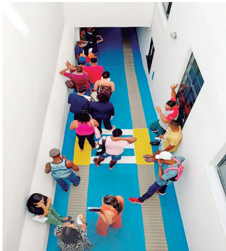
Fila de trabalhadores em Salvador para entregar carta e se recusar a contribuir com o sindicato