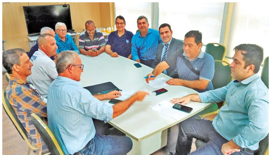
Diretoria do Sindhotéis e do sindicato patronal de Mata de São João assinam Termo Aditivo

Para manter toda essa estrutura funcionando, precisamos do apoio da categoria e é através da mensalidade dos associados e da taxa assistencial (valor dividido em 2 parcelas anuais) que conseguimos manter uma estrutura mínima de luta.