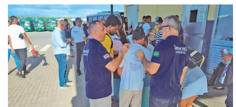
Trabalhadores e sindicatos presentes na Assembleia para assinatura da Convenção Coletiva