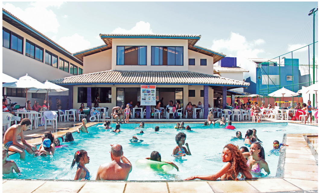
Venha conhecer o Centro Desportivo e Cultural Sindhotéis e aproveitar este espaço que é da categoria.

Para alegrar ainda mais o dia especial para a criança teremos a dis-